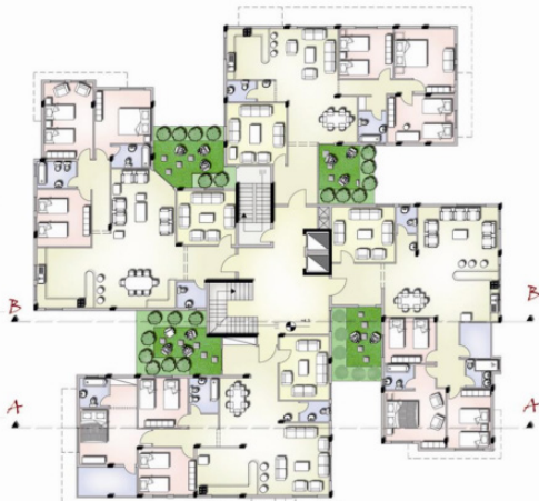
مسقط الطابق الأول

وفي سياق الحفاظ على المضمون التراثي في العمارة يظهر الشكل (١) حلاً من أحد الطالبات في المستوى الثالث لعمارة سكنية متعددة الطوابق يتضح فيه الحرص على الخصوصية للمداخل، وتوفير فكرة الانفتاح على الفناء الداخلي التراثية، حيث تم توفير مكان لشرفة متسعة تكون بمثابة حديقة خاصة صغيرة لكل شقة في كل طابق تطل عليها فراغات حيوية بالشقة.